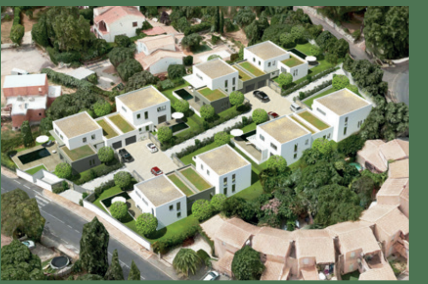
Terrains à bâtir, suggestions architecturales non contractuelles.